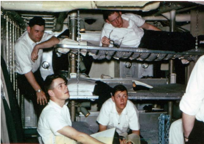
8 Mess – Prestonian Class Frigate 1961 Punka louvres – pas de climatisation

Notre programme se concentrera sur la commémoration du centenaire de la Réserve navale et les réalisations de ses membres actuels et passés, y compris ceux qui ont participé à ses divers programmes de formation d'officiers de l' UNTD au ROUTP , NROC et RESO et au-delà.